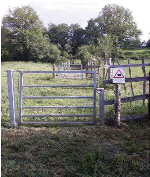
Merci de refermer le portillon ! Fin d'itinéraire et arrivée sur Burgnac.