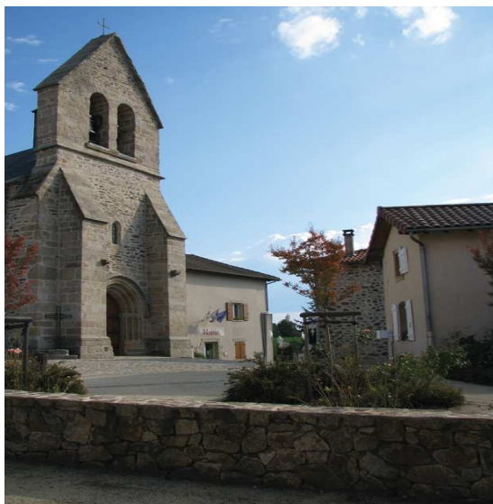
Le bourg de Burgnac, la mairie et l'église.