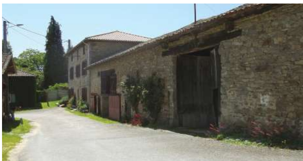
Vieilles granges à la Mazière