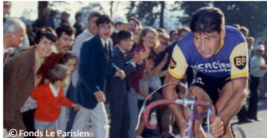
Cycling loop worked thanks to the assistance of Raymond Poulidor in 2014, by the tourist Office. May he be thanked for the time he spent telling us about his travels and passing down this heritage to you. Nice trip!

Winner of 189 races including Milan-San-Remo, Vuelta, Grand Prix des Nations, Paris-Nice, Flèche Wallone and Critérium du Dauphiné, he never won the Tour de France , in 14 participations, despite 8 podiums and 7 stage victories , remaining the "eternal second" ... but the first in the heart of french people!