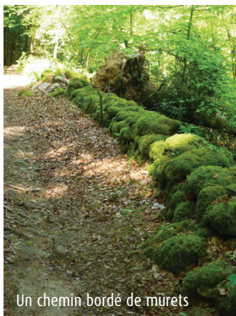
Un chemin bordé de mûrets

6 Suivre à droite la "rue Jean Moulin", passer devant la mairie et prendre en face la rue de la Libération. Continuer jusqu'à la place A. Dufraisse, point de départ du circuit.