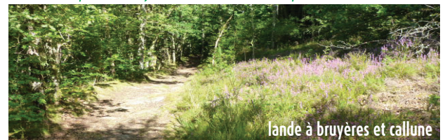
lande à bruyères et callune

★ A droite, en descendant, prendre le temps d'admirer un reliquat de lande. Milieu commun au XIXème siècle, les landes couvraient alors 32 % du Limousin et étaient pâturées. Aujourd'hui on n'en retrouve que 0.2 % !