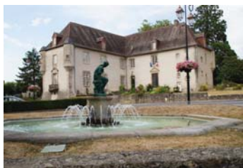
L'hôtel de ville de Bellac, la fontaine

★ A l'angle de l'avenue Jean Jaurès, la maison natale de Jean Giraudoux. Le 1er festival Jean Giraudoux fut inauguré par Madeleine Renaud et Jean-Louis Barrault en 1957.