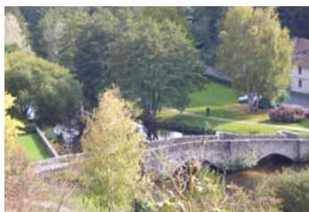
Une vue sur le pont de la Pierre