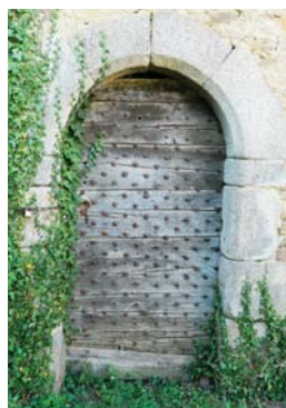
Porte à la Genette