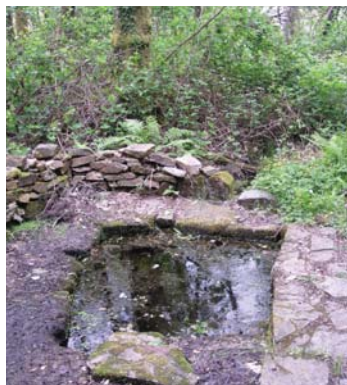
Bonne fontaine, sur le site privé des bonnes fontaines

L'arbre à prières ou arbre votif est une coutume religieuse pratiquée dans de nombreuses régions du monde. Elle consiste à utiliser un arbre vivant, ou une partie coupée d'un arbre que l'on plantera en un lieu bien choisi, comme support à des requêtes que les hommes font aux esprits. Ce type de culte est pratiqué notamment dans les religions chamaniques. (Source Wikipédia)