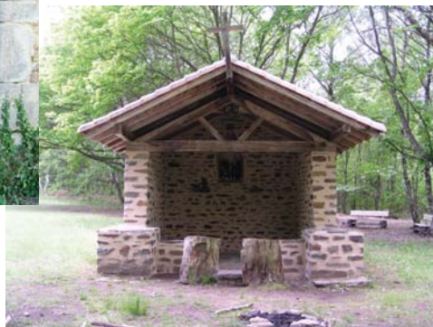
Oratoire des bonnes fontaines

Les fontaines à dévotions constituent un patrimoine emblématique du Limousin. Parmi celles-ci, les " bonnes fontaines " de Cussac jouissent d'une très forte notoriété. Le site qui les accueille, pittoresque et agréable, a été spécialement aménagé afin de partir à la découverte de ses fontaines, de ses richesses naturelles et culturelles et de l'histoire du lieu grâce aux panneaux d'information qui le jalonnent (fontaines, oratoire, batraciens, châtaigneraie). Les bonnes fontaines se prêtent également à la détente et au pique-nique : tables, bancs, boulodrome... sont à votre disposition. Le peuplement de châtaigniers, conduit en verger, agrément le site et apporte ombrage et fraîcheur. (Source PNR PL)