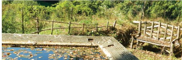
Un lavoir à la Bénéchie

L'arbre à prières ou arbre votif est une coutume religieuse pratiquée dans de nombreuses régions du monde. Elle consiste à utiliser un arbre vivant, ou une partie coupée d'un arbre que l'on plantera en un lieu bien choisi, comme support à des requêtes que les hommes font aux esprits. Ce type de culte est pratiqué notamment dans les religions chamaniques. (Source Wikipédia)