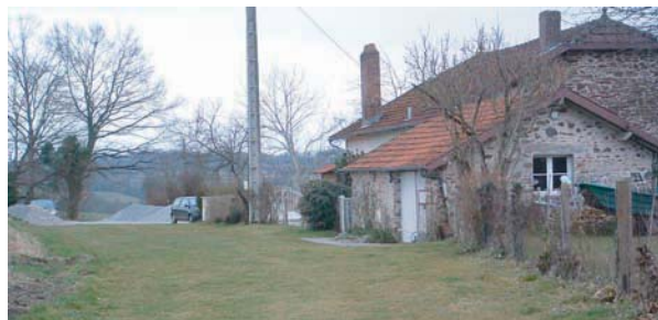
Chemin sur le circuit du Bois Badaraud