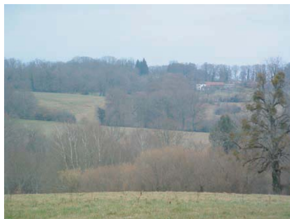
La verte campagne douce et généreuse de Saint-Bonnet-Briance

L'histoire raconte que c'est dans cette commune que Mirabeau aurait mis au point avec son père, Victor Riqueti Mirabeau, le 1 er conseil de prud'homme.