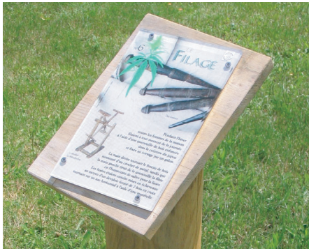
Borne d'information sur le thème du Chanvre

6 Arrivé à la route, tourner à droite et dans le village des Baschauds à nouveau à droite pour rejoindre la D 10. S'engager en face dans l'allée du château qui ramène au bourg. Au niveau du lavoir communal, traverser la route et rejoindre en face le champ de foire.